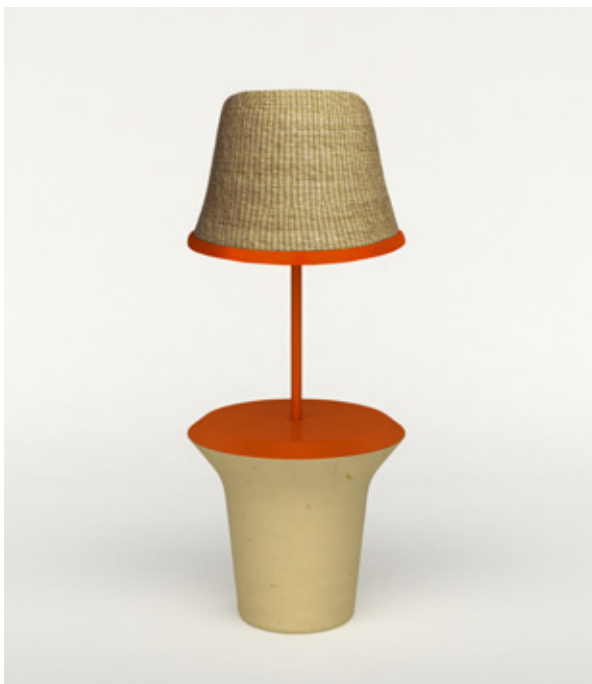
Table / Lamp in limestone with lacquered top and woven rattan shade. The conical shape evokes the ramparts erected to fortify and defend the walls of the town of Gallipoli and Otranto.

Tavolino/Lampada in pietra leccese con piano laccato e paralume in giunco intrecciato. La forma rievoca i bastioni tronco conici eretti a fortificare e difendere le mura delle città di Gallipoli e Otranto.